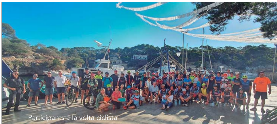
Participants a la volta ciclista