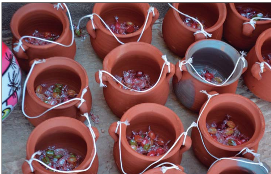
Tot a punt per a la rompuda d'olles