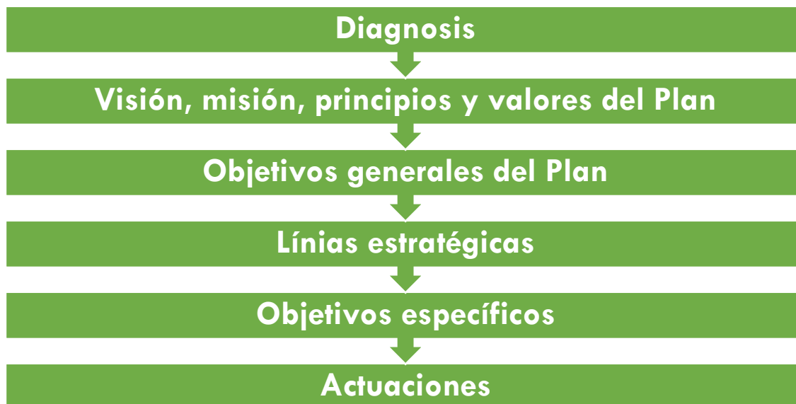
Figura 1. Pasos de la metodología

Para entender la estructura del Plan resulta importante explicar la metodología que se ha utilizado para su elaboración. El punto de partida de todo ha sido el Diagnóstico realizado. Es solo con la imagen de la situación en el municipio que se puede avanzar desde los planteamientos más abstractos hasta las actuaciones concretas.