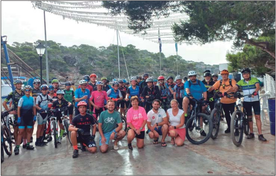
Participants a la volta amb bicicleta 2023