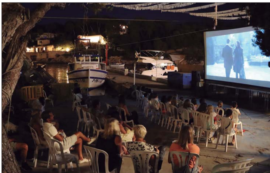
Nit de cinema