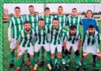
CE ALQUERIA (I REGIONAL)