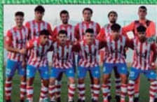
CE SANTANYÍ (III DIVISIÓ)