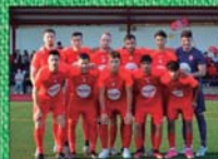
CE ARTÀ (I REGIONAL)