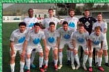
CE FELANITX (III DIVISIÓ)