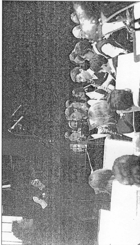
LA ESCUELA MUNICIPAL DE MÚSICA DE SANTANYÍ EN EURODISNEY. Esta Banda Joven celebró el pasado martes su décimo aniversario en el famoso parque de atrac-